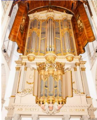
Van Hagerbeer-Schnitger-orgel in de Grote Kerk Alkmaar.

Katrollen piepen zacht wanneer de luiken van het majestueuze orgel van de Grote Kerk Alkmaar langzaam worden opengetrokken. De schildering van de triomftocht van koning Saul na Davids overwinning op Goliath wijkt, en terwijl het gigantische Van Hagerbeer-Schnitger-orgel zich openbaart, marcheert er een gepuncteerd ritme met volle akkoorden als zware voetstappen door de kerk. Het is de snoevende reus Goliath, uit de Eerste Bijbelse sonate van componist Johann Kuhnau (1660-1722).